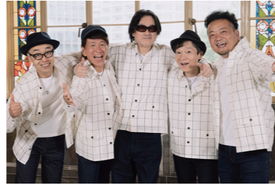
チキンガーリックステーキ

1990年の結成以来アカペラ一筋、確かな実力と心に響くハーモニー。今年は夏も、神戸で生まれた5人組が松方ホールに帰ってきます。スタンダードナンバーからオリジナルまで、心ゆくまでご堪能ください。