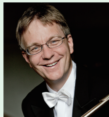
ミハエル・マルティン・コフラー

5/16(土)開演15:00(開場14:30) 【出演】ミハエル・マルティン・コフラー (fl)、矢野正浩(指揮) 【曲目】C.Ph.E.バッハ:フルート協奏曲 二短調 wq.22、メンデルスゾーン:フルート協奏曲(ヴァイオリン協奏曲を編曲) 二短調 ほか