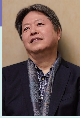
タケカワユキヒデ

【曲目】ポートピア、ガンダーラ、モンキーマジック、ビューティフル・ネーム、銀河鉄道999 ほか ピアノの弾き語りとプライベートな語りで構成。通常とはひと味違うタケカワユキヒデの世界へ是非お越しください。